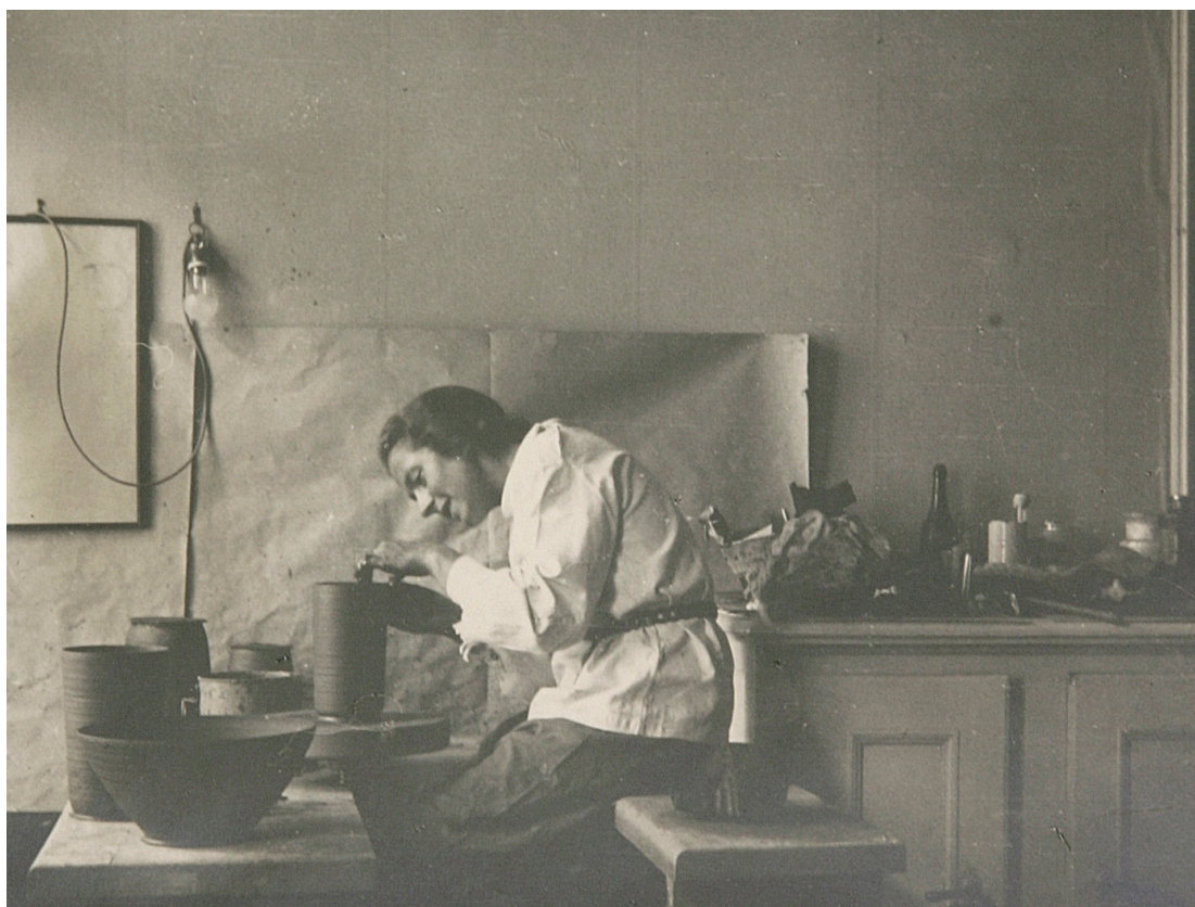
Lucie Rie ved drejeskiven, Wien, 1930'erne.