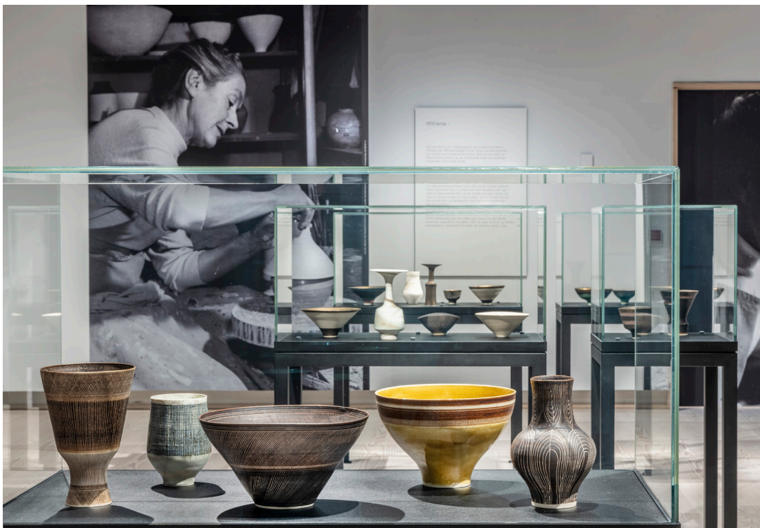
Lucie Rie - The Adventure of Pottery, CLAY Keramikmuseum 2024.

Unik, håndlavet keramik, der som regel er lavet af en enkelt person eller en lille gruppe. I Storbritannien omkring slutningen af det 19. årh. opstod studiókeramiken med afsæt i fra Arts & Crafts-bevægelsen, som dyrkede håndlavede genstande og de traditionelle teknikker inden for kunsthåndværk.