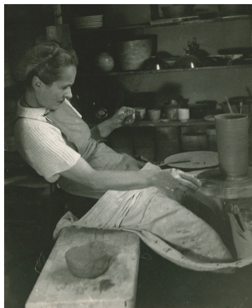
Lucie Rie ved drejeskiven, London, 1950'erne.

Som emigrant i England skulle man på det tidspunkt søge om arbejdstilladelse for at lave keramik, hvilket Lucie Rie ikke fik. På trods af sin succes i Wien er Rie ukendt i London og kæmper for at slå igennem i den mandsdominerede keramikbranche. Nødsaget måtte Rie derfor søge arbejde på en glasfabrik, der blandt andet producerede brugskunst og knapper i glas til modehuse i Europa.