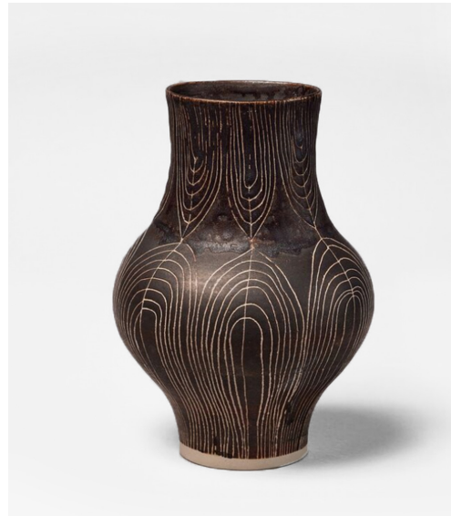
Lucie Rie, Vase, porcelæn med manganglasur og sgraffito-dekoration, ca. 1950.