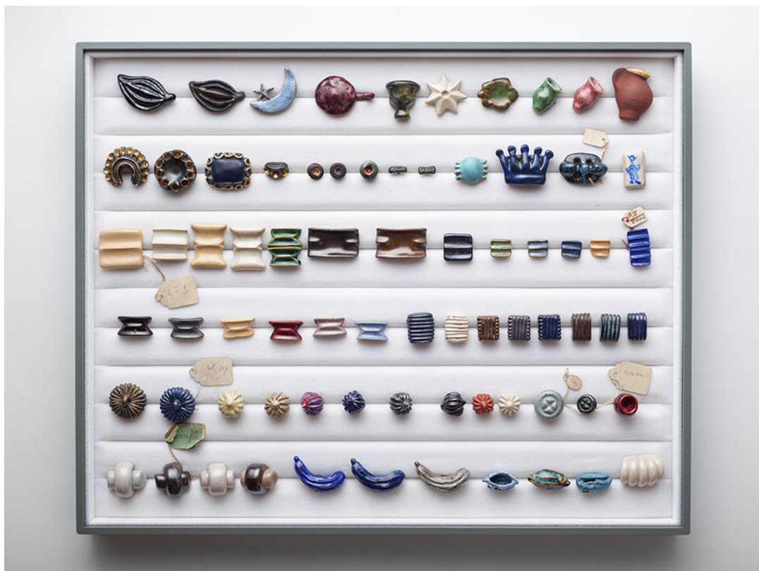
Lucie Rie, knapper, 1940'erne, lertøj.

Rie underviser på Camberwell School of Arts i London fra 1960 til 1971. Hendes undervisning fik stor betydning for en ny generation af keramikere og den moderne studiokeramik i England. Rie fortsætter med at lave keramik indtil begyndelsen af 1990'erne, hvor hun rammes af et slagtilfælde. Lucie Rie dør i 1995. I dag betragtes Lucie Rie som én af de mest indflydelsesrige keramikere i det 20. århundrede.