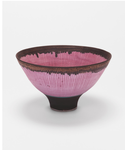
Lucie Rie, Skål, 1990. Porcelæn med rosa glasur, indlagte linjer, turkis mangan på kanten. 19,5 cm diameter. Privateje.

Værket "Skål" (1990) er et godt eksempel på Lucie Ries sans for form, farver og detaljer. Den lille, sorte fod får det til at se ud som om, at skålen næsten svæver. Rie har brugt en lyserød glasur dekoreret med lodrette linjer, som fremhæver skålens højde. Øverst har hun brugt en glasur, der ligner bronze. Læg mærke til den blå detalje i bunden af skålen.