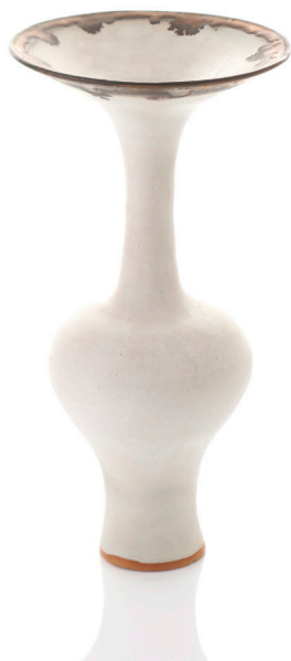
Lucie Rie, Vase, 1982. Stentøj med hvid glasur og gylden mangan-kant. Privateje.

Når vi snakker om møbler, bruger vi ofte kropsdele til at beskrive dem: Fx bordben, stoleryg og armlæn. Det samme er tilfældet for keramik: Her bruger man ord som fod, krave, skuldre, mave, munding og fod. Værket "Vase" (1982) må siges at have en lang "hals".