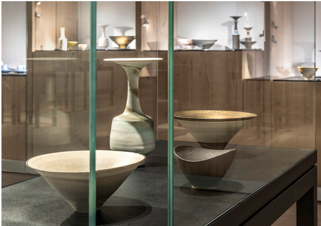
Lucie Rie - The Adventure of Pottery, CLAY Keramikmuseum 2024.