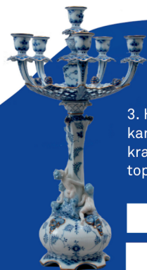
Arnold Krog Musselmalet Kandelaber, 1886

3. Hvilket dyr kan du finde kravende mod toppen af lysestagen