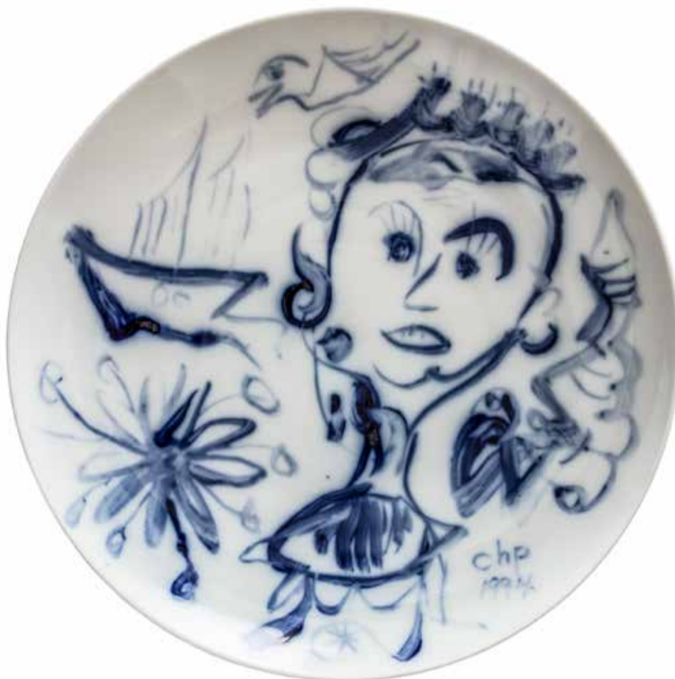
Carl-Henning Pedersen Fad, 1994 Porcelæn 6,1 x 36,5 cm Sidsel Ramson donation, CLAY Keramikmuseum

af Christina Rauh Oxbøll, museumsinspektør