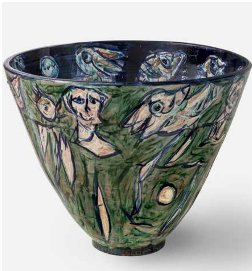
Carl-Henning Pedersen Krukke, 1996 Lertøj, 51 x 54 cm Tilhører Ny Carlsbergfondet, dep. Panum Institutttet

Fra 1994 fik Carl-Henning Pedersen mulighed for at forsøge sig med lertøj og begitningsfarvernes store farvepalet. Det var Peter Brandes, der på dette tidspunkt udførte en række monumentale opgaver på Royal Copenhagen, som på fabrikken introducerede lertøjsler og begitningsfarver fra fætter Jør-