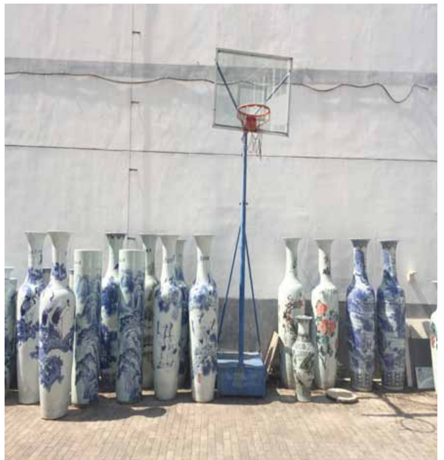
The Big Pot Factory med produktion af klassiske kinesiske vaser

Vi var i alt 130 udstillere fra hele verden, der deltog i en fælles udstilling, og på markedet de næste tre dage fik vi selskab af 300 kinesiske keramikere og kunsthåndværkere.