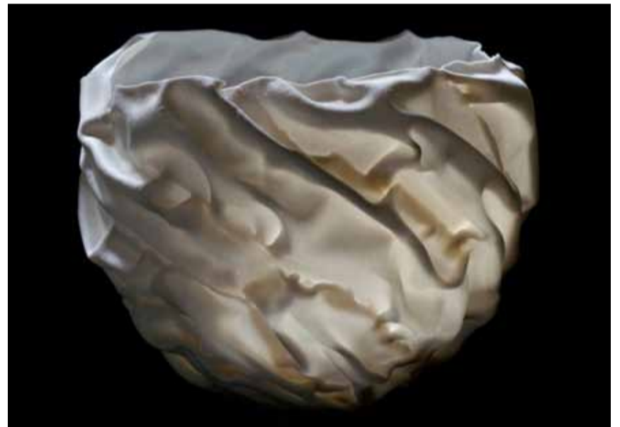
Simon Koefoed Skål i porcelæn

Udstillingen kan besøges fra 17. januar - 29. marts 2020 Galleriet har åbent alle ugens dage kl. 11-17, tlf. 98960661, mail: gallerivisby@gmail.com