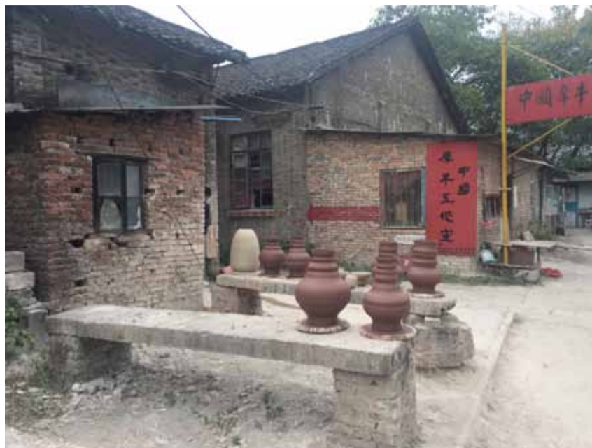
The Sculpture Factory med mange små keramiske værksteder

Rejsen blev støttet af Statens Kunstfond.