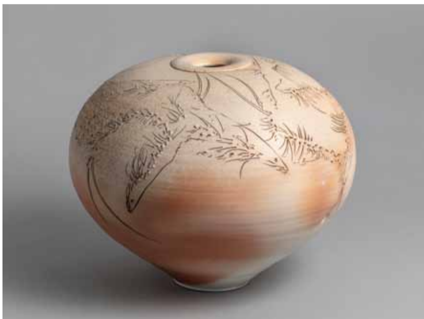
Frank Boyden Fiskevase, 1990

af Christina Rauh Oxbøll, museumsinspektør, CLAY