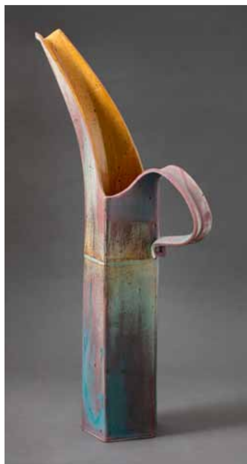
Niels Huang Megakande , 2010 CLAY Samlingen

Udstillingen kan besøges på CLAY fra den 17. november til den 3. maj 2020.