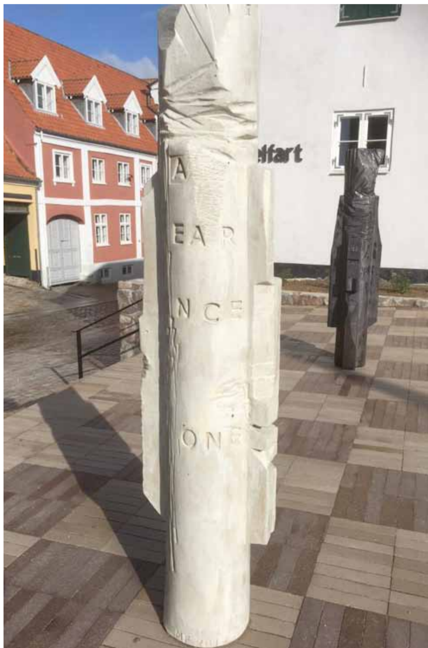
Magne Furuholm Rook Takes Bishop , 2017

Nu er de tre værker fra udstillingen Store formater – kloge hænder på plads i bybilledet. Skulpturerne blev, sammen med 12 andre værker, skabt til en stor jubilæumsudstilling i 2017-18, der fejrede Tommerup Keramiske Værkstedes 30-års jubilæum.