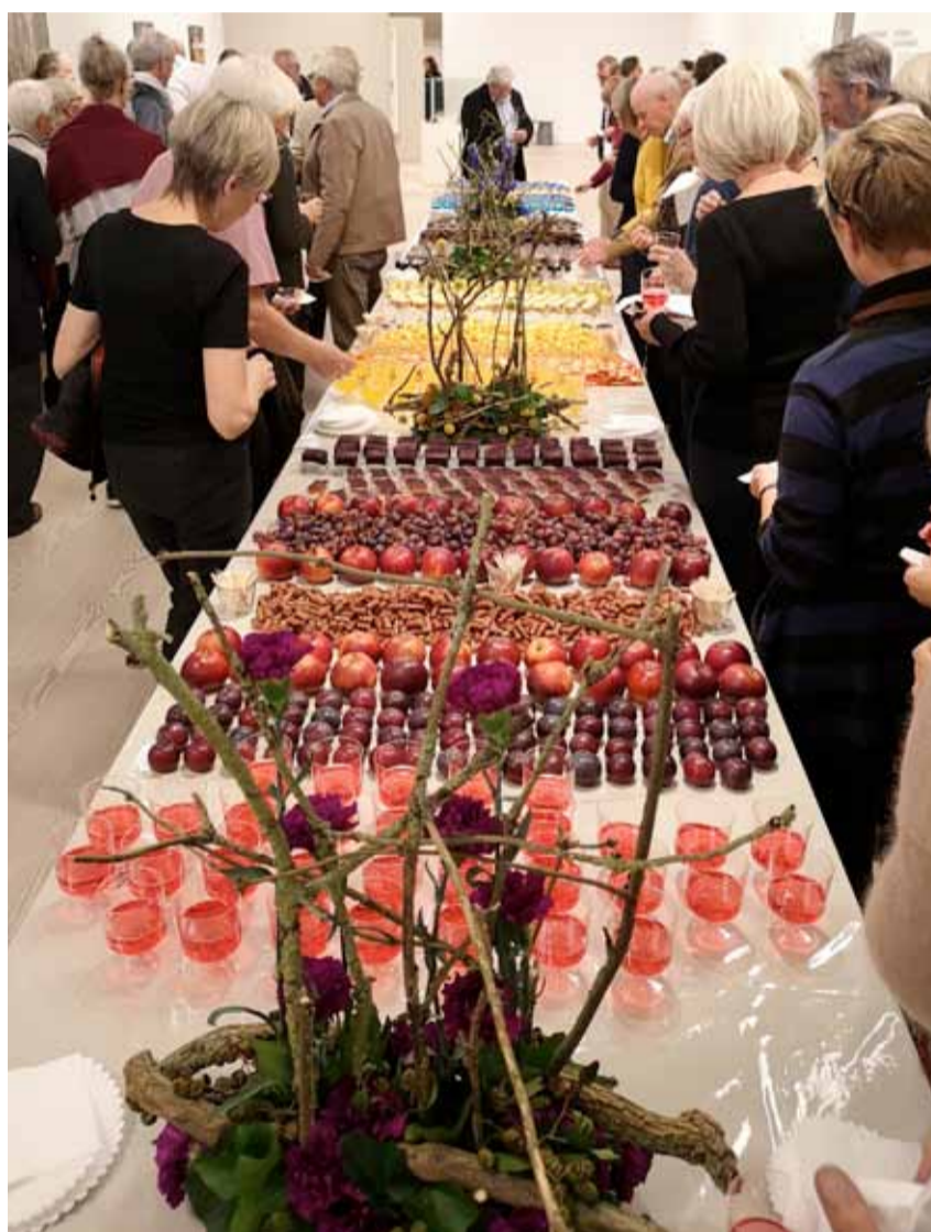
CLAY medarbejdere havde kreeret et flot langbord.