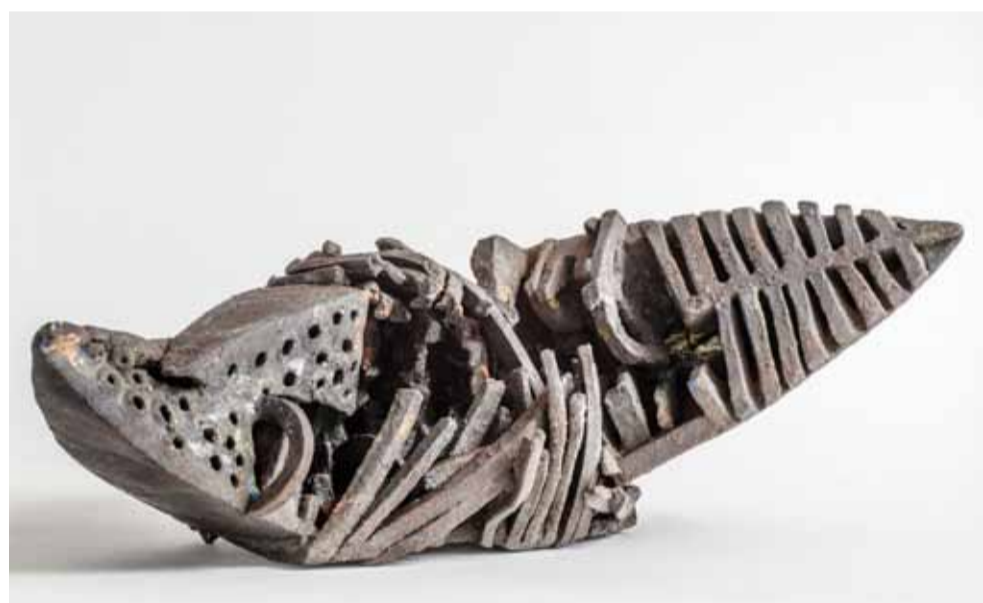
Nina Hole Båd . Uden år CLAY Samlingen