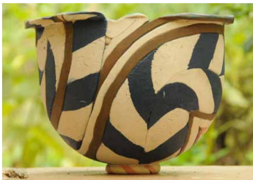
Hvem har lavet denne skål, og hvilket år? Deltag i konkurrencen

Husk at skrive dit navn og dit medlemsnummer!