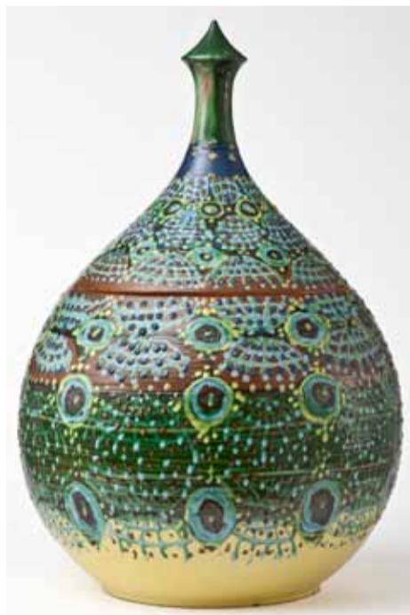
Bjørn Wiinblad (1918 - 2006)