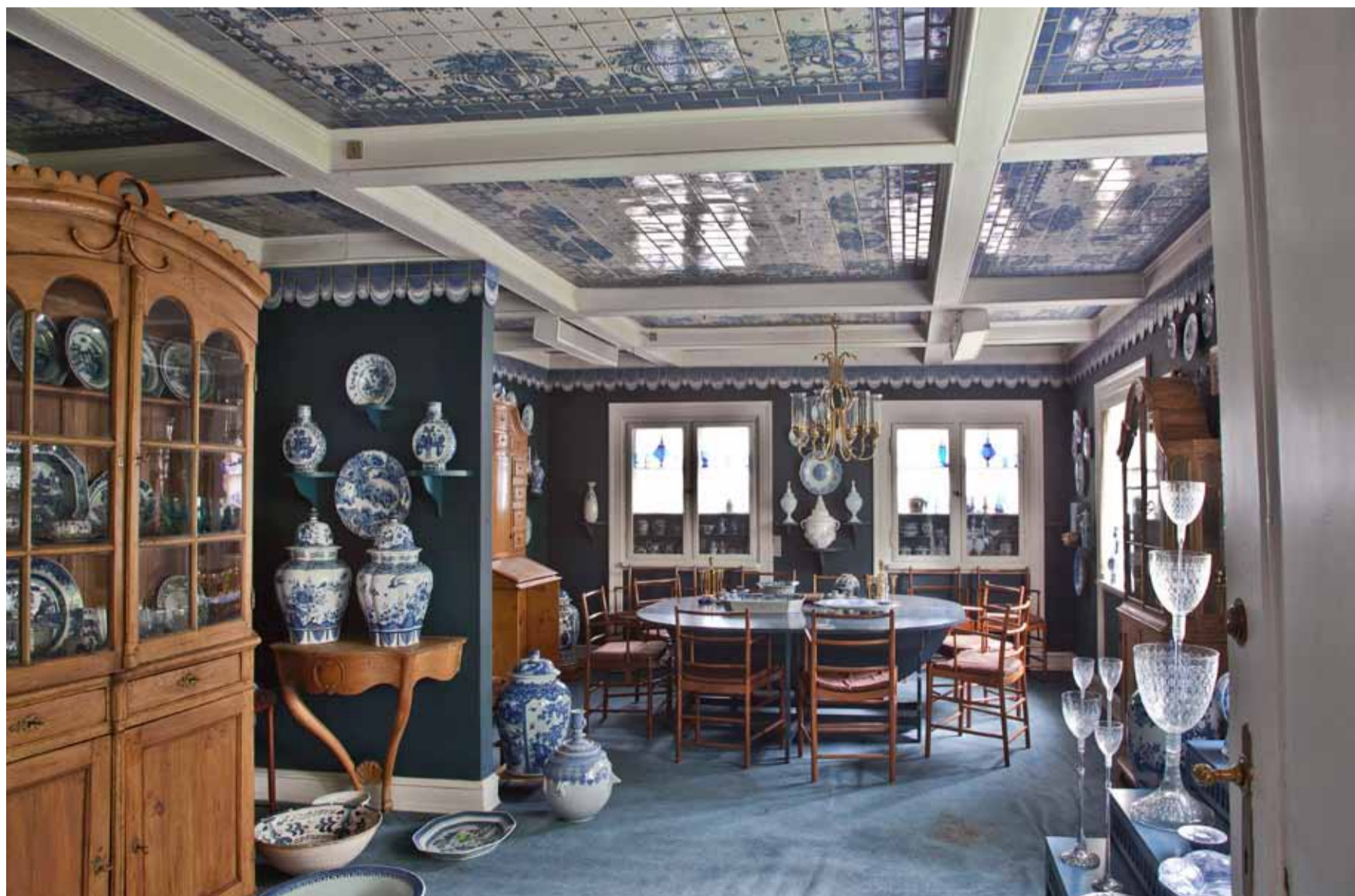
Interiør. Spisestuen i Bjørn Wiinblads hjem, Det Blå Hus i Kgs. Lyngby

Aftenen var arrangeret i et samarbejde mellem museet og CLAY Venner. sl