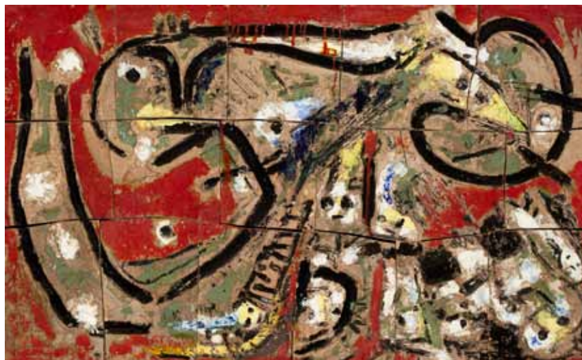
Asger Jorn: "uden titel". 1954. Vægreliet, 92 x 150 cm.