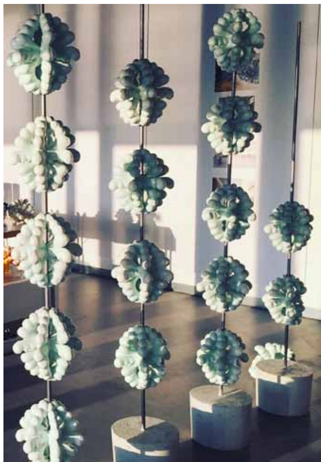
Lea Nordstrøm: Room Divider, 2017.

Der er udarbejdet et usædvanligt smukt katalog, der omtaler den enkelte keramikker og tilknyttede værker. Kataloget kan købes i museumsbutikken.