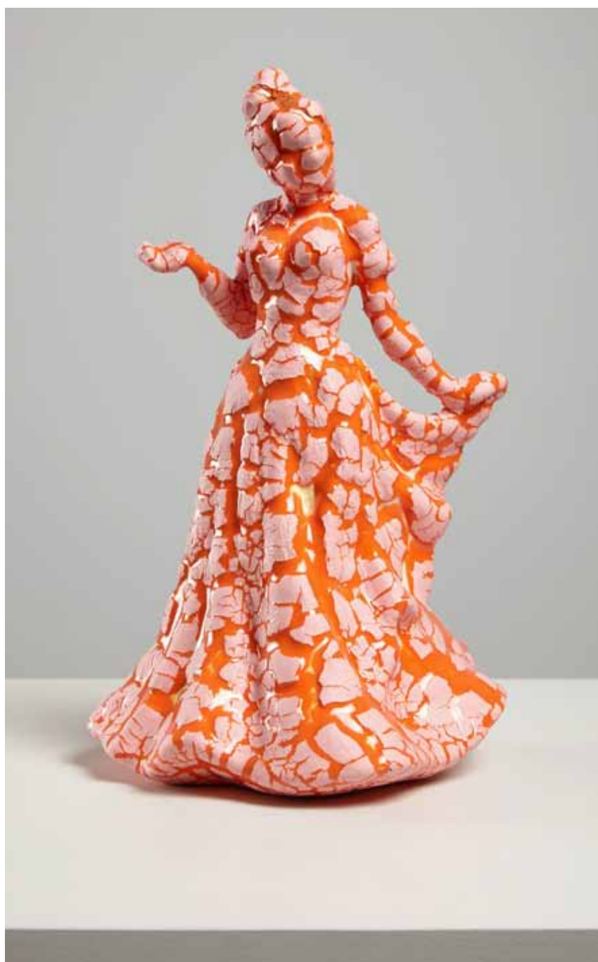
Royal Doulton Figurine, Jessica HN 4049, excellent condition. Found ceramic, glaze, image courtesy of the artist, photograph by Chris Park

I næste nummer af CLAY Nyt vil Lasse Kaae, der er kurator på udstillingen, i en større artikel sætte fokus på udvalgte værker i Figurinens Fortællinger .