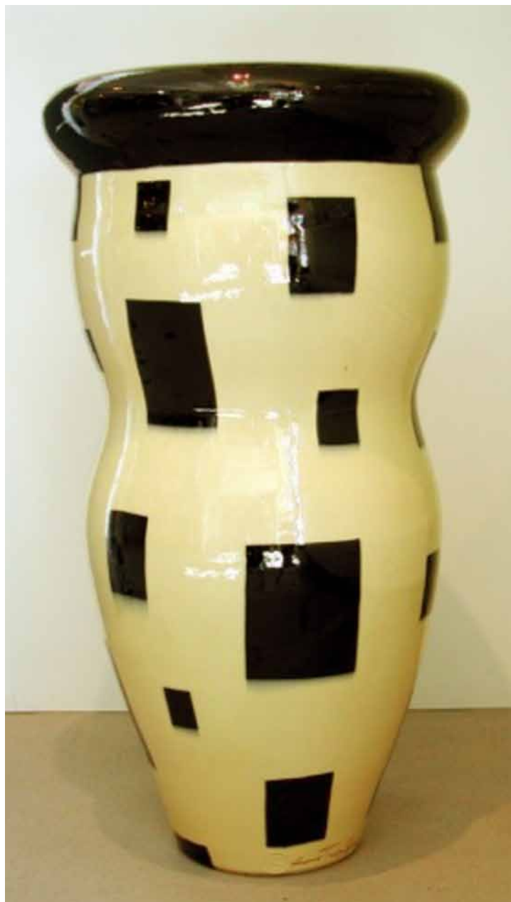
Sverre Teito Holmen: Krukke

En stor samling af større og mindre krukker af Sverre Tveito Holmen kan hen over sensommeren ses i Galleri Pagter.