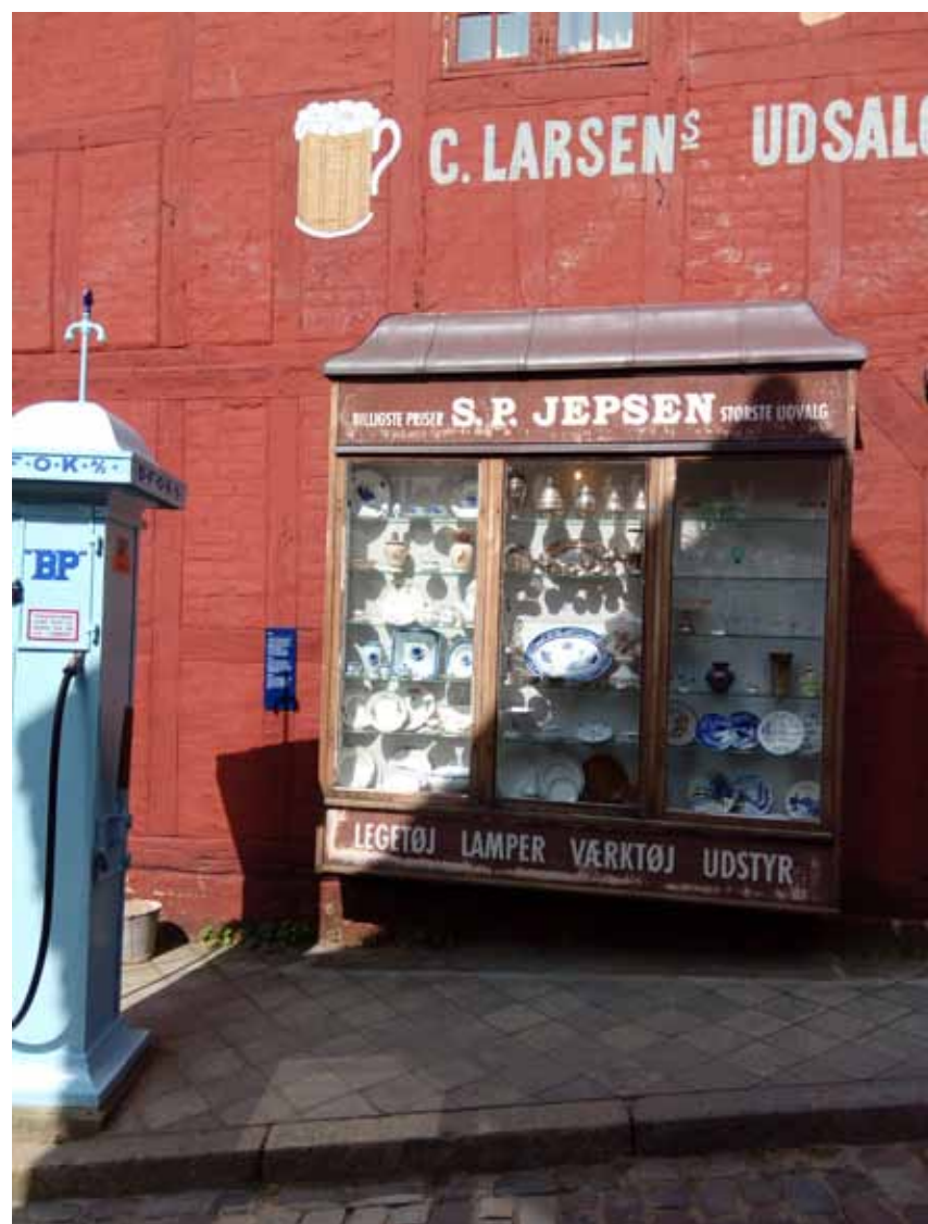
Porcelæn og anden keramik i Den Gamle By, Aarhus

Turens tema er "Når lejlighed byder sig" – i Den Gamle By og Gellerupplanen.