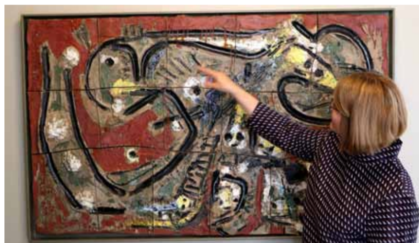
Asger Jorn: Relief uden titel 1954. H: 92 x B: 150 cm.