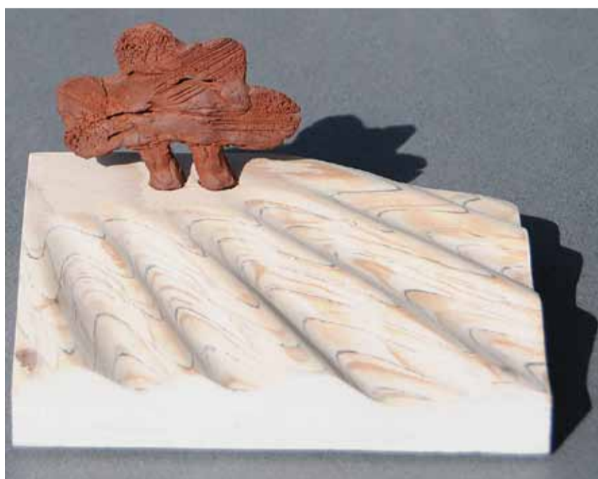
Sverre Tveito Holmen: Keramiktræ.