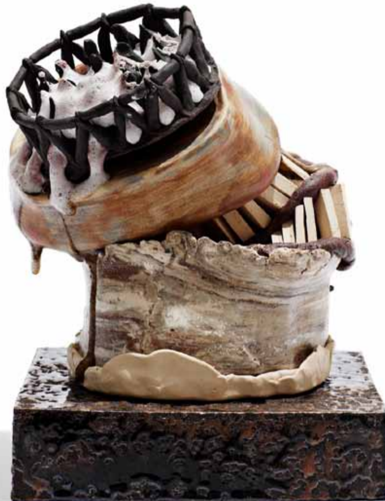
Pernille Pontoppidan Pedersen: Nikkel drypper fra uanede højder. 26x28x40 cm 2013.