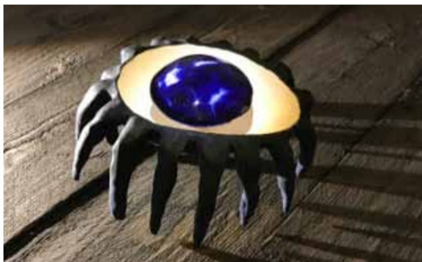
Versus: Vov at se det hele. 2017.

Her følger et indblik i de spændende køb, og hermed kan læserne allerede glæde sig til en palet af keramiske værker ud over det sædvanlige til udlodningen. Husk, at gevinsterne i løbet af året vil kunne ses i CLAY Venners udstillingsområde i underetagen på CLAY. sl