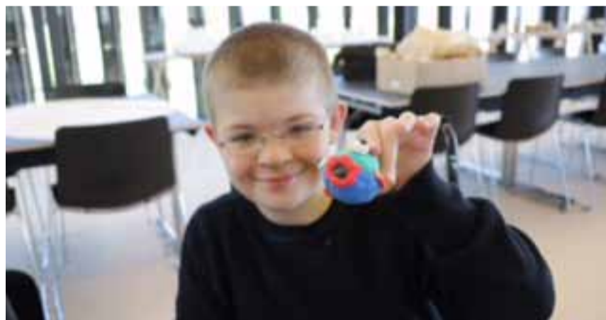
Workshop på CLAY.

Som annonceret i sidste CLAY Nyt var påskan på CLAY også for børn. Workshoppen "Form et Salto-påskeæg" var velbesøgt og inspirerende. Lasse Kaae, kunstfaglig medarbejder på CLAY, ledede workshoppen i påskedagene, hvor ca. 50 børn mødte op til et dialogbaseret museumsbesøg om Saltos keramik og efterfølgende fik muligheder for selv at opleve, at de kunne skabe et kunstværk af ler. På billederne ses skønne børn i færd med at udsmykke deres eget Salto-påskeæg. sl