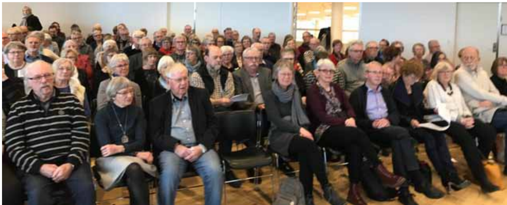
Generalforsamlingen 2017.