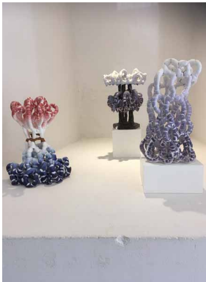
Bente Skjøttgaard: Cumulonimbus I-III . 2014. Stentøj, 20 x 25 cm.