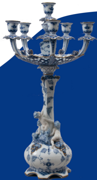
Arnold Krog, Musselmalet kandelaber, 1886

3. Hvilket dyr kan du finde kravlende mod toppen af lysestagen?