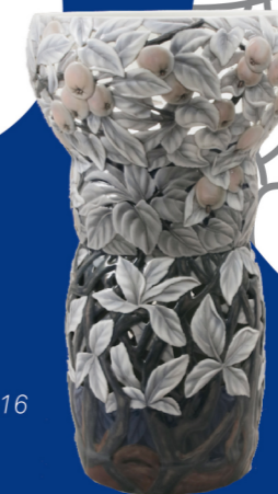
Effie Hegermann-Lindencrone, Pragtvase m. æbler, 1916

5. Find vassen med de smukke udskårne blade. Kan du farvelægge frugterne på tegningen?