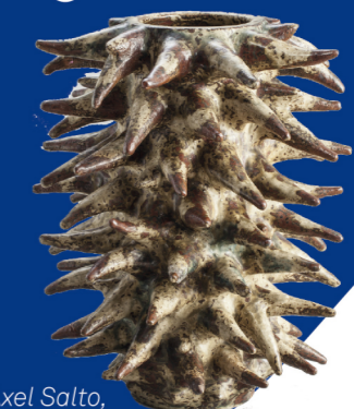
Axel Salto, Vase, uden år

5. Find vassen med de smukke udskårne blade. Kan du farvelægge frugterne på tegningen?