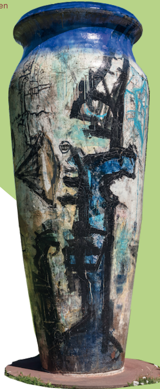
Peter Brandes Sevilla krukken, 1992

Tegn streger fra farvekortet til krukken