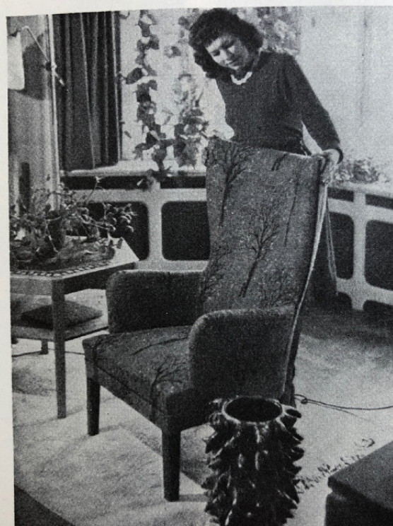
F H Stol betrukket med Mønsteret »Persisk«. Grøn Bund, lysebrune Hjorte, mørkebrune Træer, blaa Konturer.