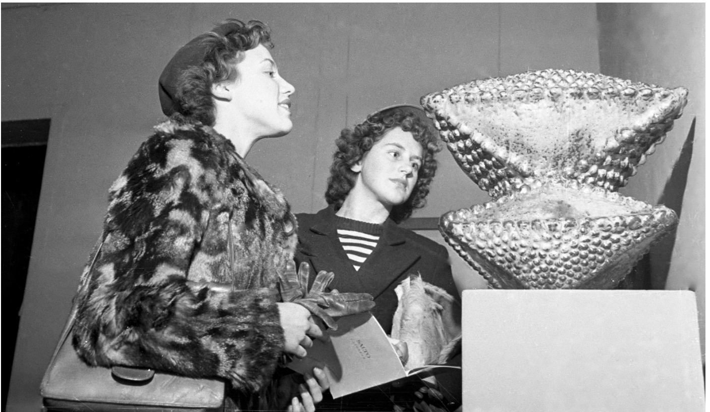
Fig. 1: Axel Saltos store trekantede vase i to etager beundres på Charlottenborg 6. november 1949 © Axel Salto / VISDA.

Overskriften er lånt fra Berlingske Aftenavis , der 5. november 1949 bragte en dugfrisk anmeldelse af Axel Saltos 60-års fødselsdagsudstilling på Charlottenborg. Dengang var det en Københavner-begivenhed, men udstillingen er også interessant i dag, bl.a. i forbindelse med mit forskningsprojekt, hvor jeg undersøger, hvordan Salto og hans stentøj blev brugt i promoveringen af Danish Modern og Danish Design på de internationale designudstillinger i 1950'erne.