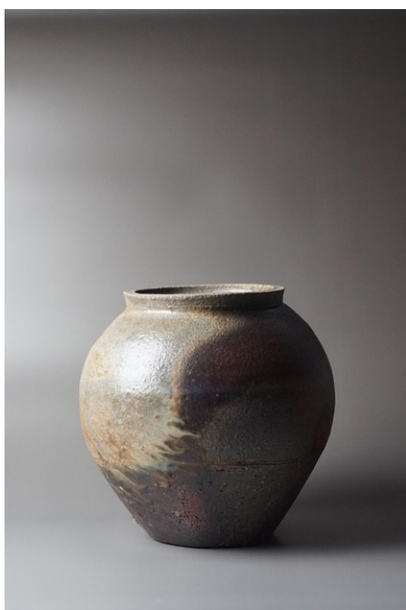
Gregory Hamilton Miller Brændefyret krukke Foto: Gregory Hamilton Miller

Fernisering den 1. marts 2024 kl. 15-16.