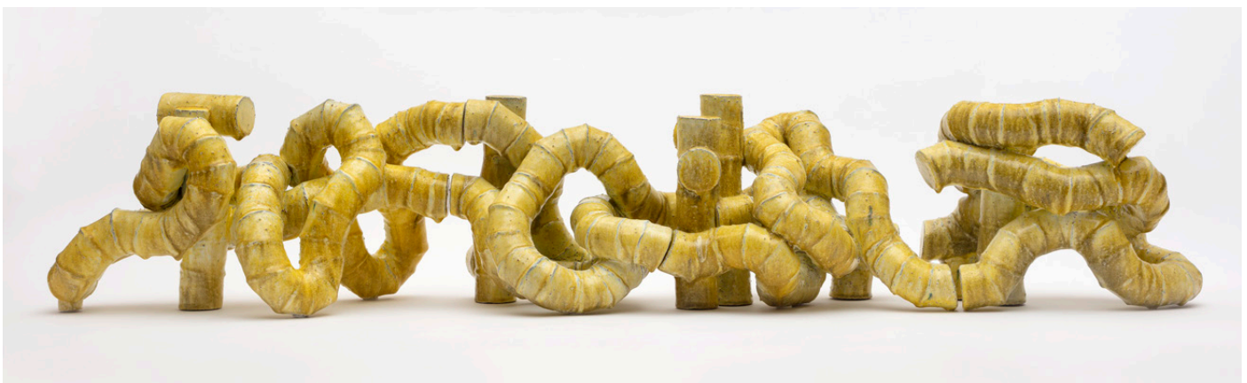
Martin Bodilsen Kaldahl Spatial Drawing #29 , 2018 H: 32 x L: 138 x D: 34 cm