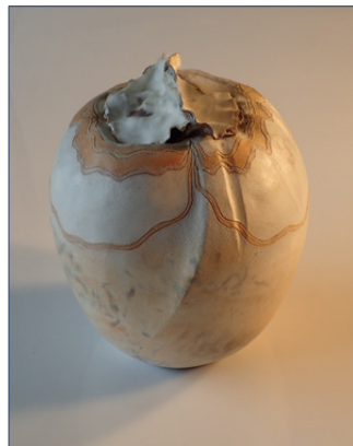
Kirsten Holm Sommerlys

Udstillingen kan besøges fra den 2. marts - den 2. maj 2024. info@mikkelberg.de