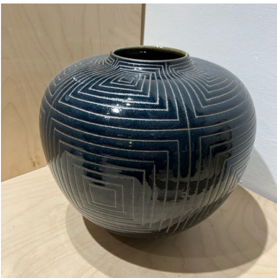
Bente Brosbøl Hansen Vase 20x25 cm Årets hovedgevinst

Indkaldelsen til generalforsamlingen kan endvidere ses i næste CLAY Nyt medio marts.