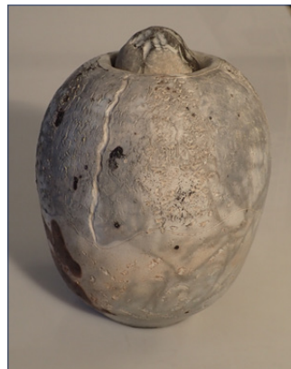
Kirsten Holm Søpinsvineform

Lønstrup Galleri Visby, Mårupgaard, Mårup Kirkevej 62, Lønstrup, 9800 Hjørring