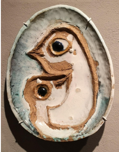
Asger Jorn Ægformet fad med to fugle, 1958

Den 15. august byder CLAY Venners bestyrelse på en heldags sommertur for CLAY Venner til Silkeborg.