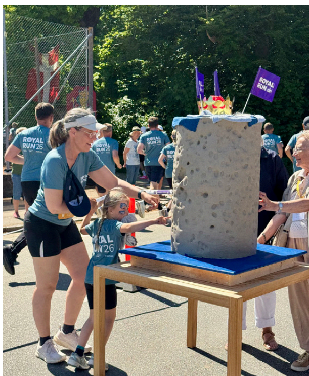
Royal Run i Middelfart

En helt særlig keramisk fælleskrukke blev skabt, da 5 km-løberne spurtede forbi CLAY Keramikmuseum den 25. maj