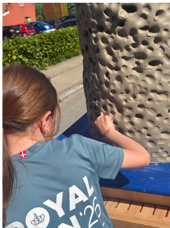
Fælleskrukken dekorerer