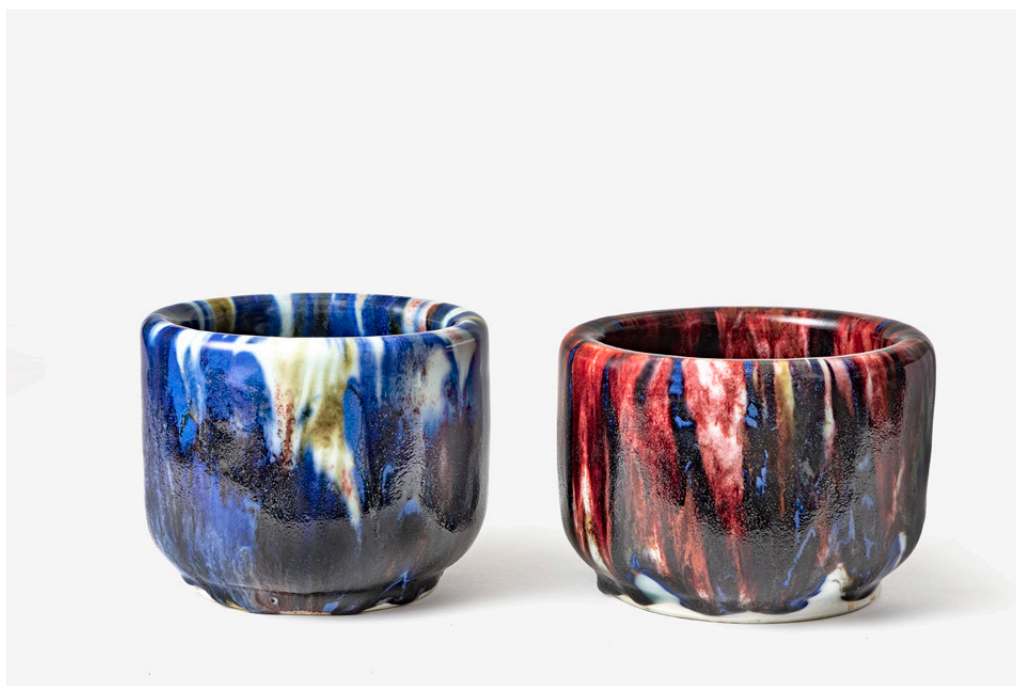
Ivan Weiss Krukker, brændt i kulovn, 2002

Nogle af dem indgår i udstillingen. Et begrænset udvalg sælges under udstillingen i museets butik og kan kun købes her, så skynd dig forbi, hvis du vil sikre dig et unikt eksemplar.