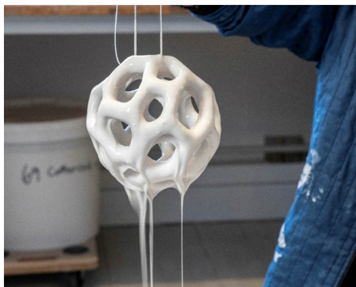
Bente Skjøttgaard glaserer et værk

Udstillingen Bente Skjøttgaard - Natur og glasur vises fra den 6. april til den 26. oktober 2025.