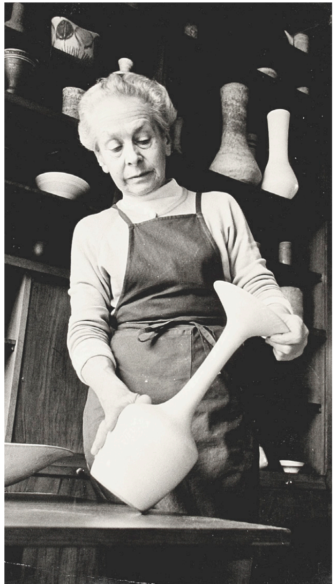
Portræt af Lucie Rie i sit værksted i Albion Mews, London

Glæd jer. Som optakt til udstillingen vil I kunne læse en længere artikel om keramik-fænomenet Lucie Rie i næste nummer af CLAY Nyt, nr. 5, oktober 2024.