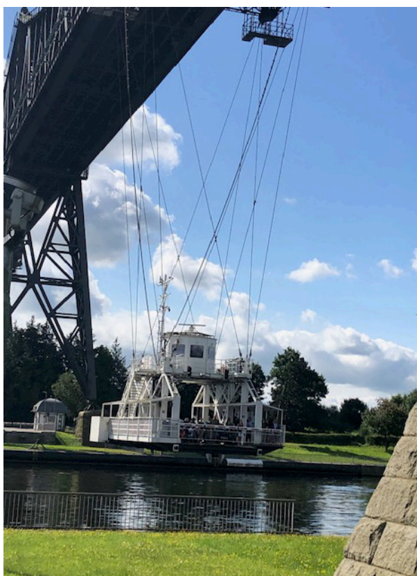
Svævefærgen under den gamle jernbanebro over Kielerkanalen

Udstillingen vises dels i Carlshütte, et nedlagt kæmpestort jernstøberi på 22.000 m 2 , der lader den imponerende kunst komme til sin ret, og dels i støberiets store, smukke park på 80.000 m 2 .