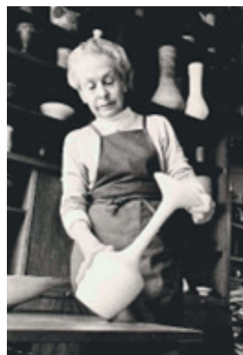
Lucie Rie in her studio