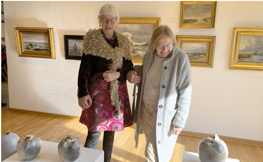
Kirsten Holm fortæller om sine værker