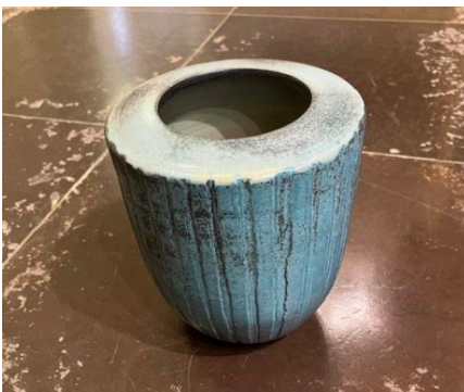
Bibi Hansen Vase

Udpluk af gevinster til generalforsamlingen 2024