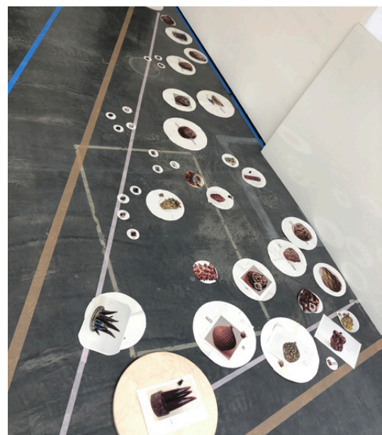
Kuratering af scenografiens ovn: Vi prøver os frem med tape og papir