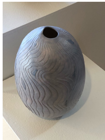
Kirsten Holm Havstrømninger

Rettelse af dato for udstillingslængden: Udstillingen er åben fra den 2. marts – 20. maj 2024.