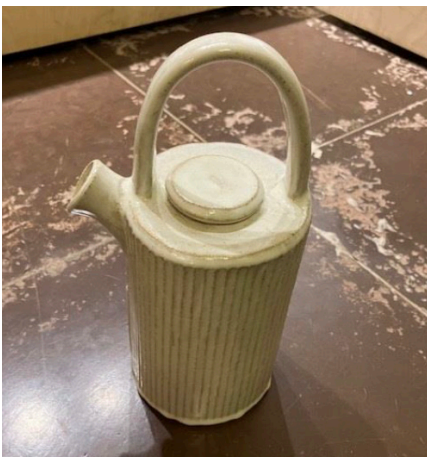
Gitte Vammen Tekande