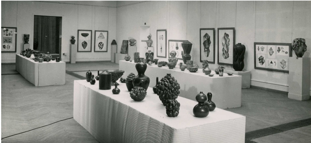
Fra Axel Salto udstilling på Charlottenborg i 1949 © Axel Salto / VISDA