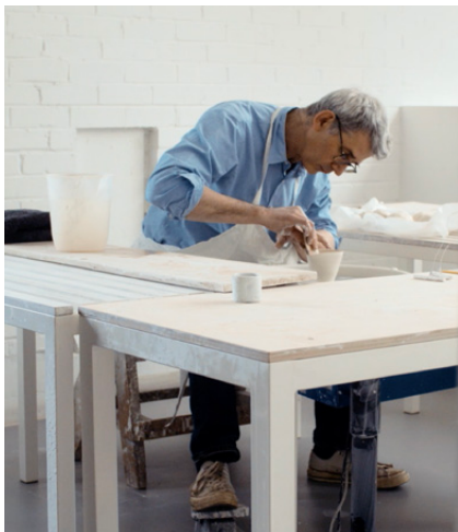
Edmund de Waal ved drejeskiven i sit atelier i London Stillbillede fra udstillingsfilm, 2023 © Figure Film og Edmund de Waal

Edmund de Waal bruger mellemrummet som medspiller i sin egen kunst, og han sagde derfor fra starten, at udstillingen skulle være rig, men at der samtidig skulle være luft imellem værkerne. Åndedræt og plads.