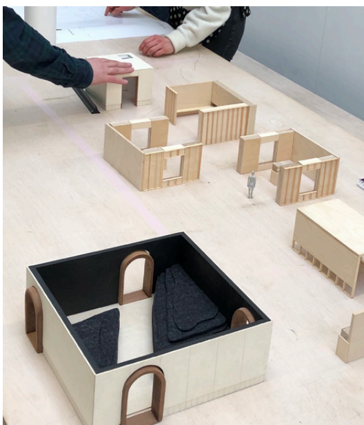
HK Architects præsenterer skitser til udstillingens scenografi

Selv om de to kunstnere udtrykker sig forskelligt, så deler de oplevelsen af kreativitet som noget, der indebærer både fejl, rod, leg og fare. Den kreative proces er et uforudsigeligt sted - ligesom den glohede keramikovn, hvor ting både kan lykkes og flække. Edmund besluttede derfor, at udstillingens første rum skulle bygges som en ovn, så Saltos farverige keramik kunne placeres i et ulmende rum, i et brændende nu, hvor den hører hjemme.