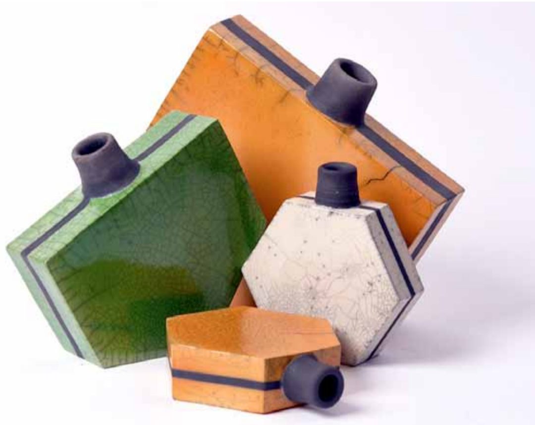
Kate Kanstrup Seks-kantede dunke Rakubrændt, pladeteknik