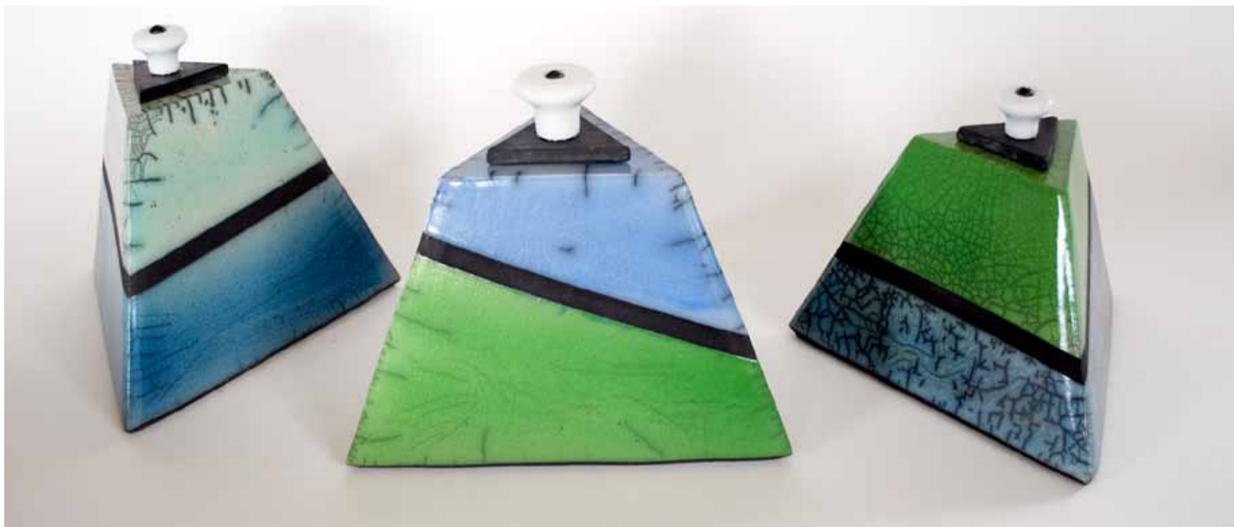
Kate Kanstrup Container Rakubrændt, pladeteknik