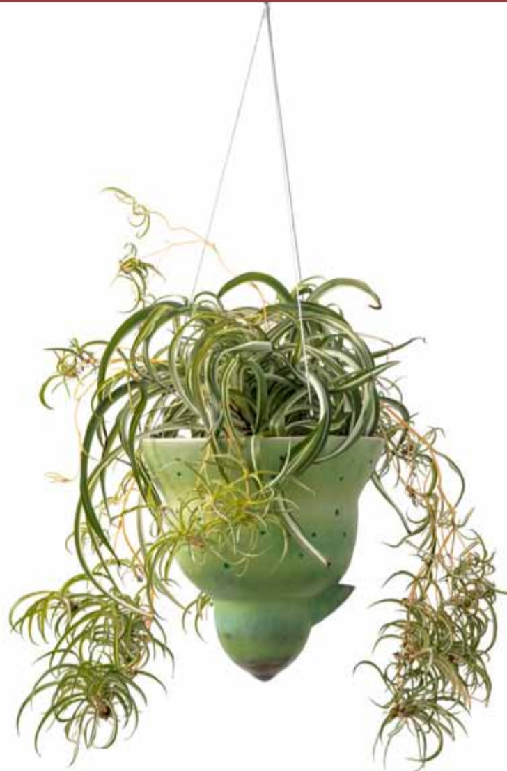
Lis Biggas Hængeurtepotte, 2016-18 Stentøj