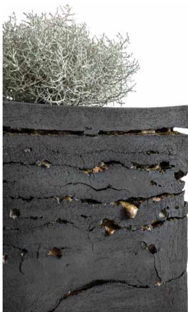
Vinni Hedegaard Frederiksen Nøjsom , 2018 Stentøj, ler opgravet fra endemoræne