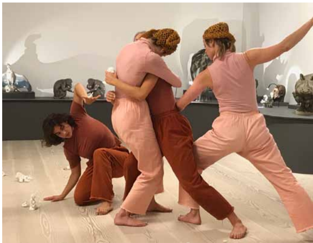
V Figurines danser i Figurineudstillingen på årets keramikmarked.

Oktober 2018. Næste nr. udkommer primo november.