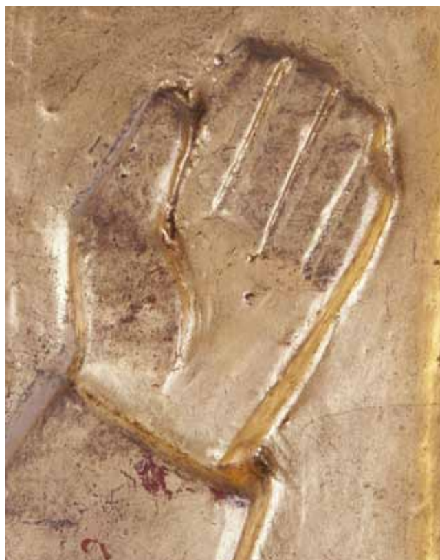
Detalje af Jesu hånd fra relieffets midterfelt med motivet Himmelfarten .

I disse uger er værket hos konservator Jens Gregers Aagaard. Årtiers smuds og støv samt mere eller mindre heldige restaureringer skal udbedres. Det er en langsommelig proces at ren-