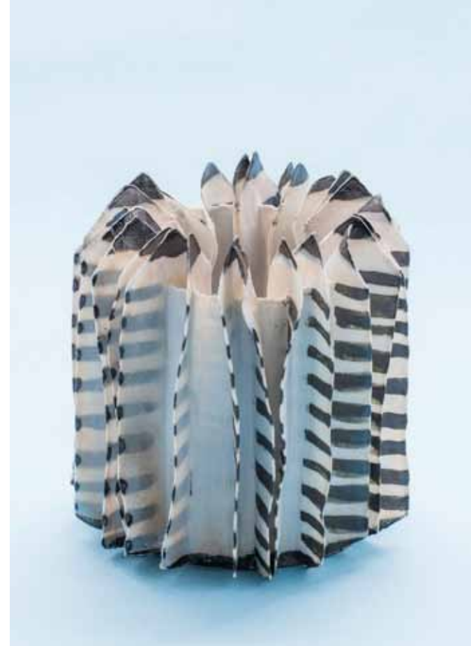
Ornitologisk arkitektur, 2013. Porcelæn og fiberglas, højde 14 cm. Keramiske Veje 2015, Sophienholm