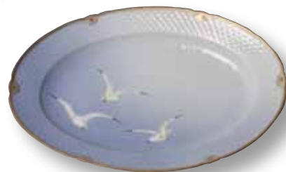
Fanny Garde: Fad, Mågestel. 1890erne, 35 x 51 cm

Allan skildrer deres baggrund på B&G, skildrer deres motivvalg gennem kendte og mindre kendte værker og sammenligner dem med samtidige kolleger.