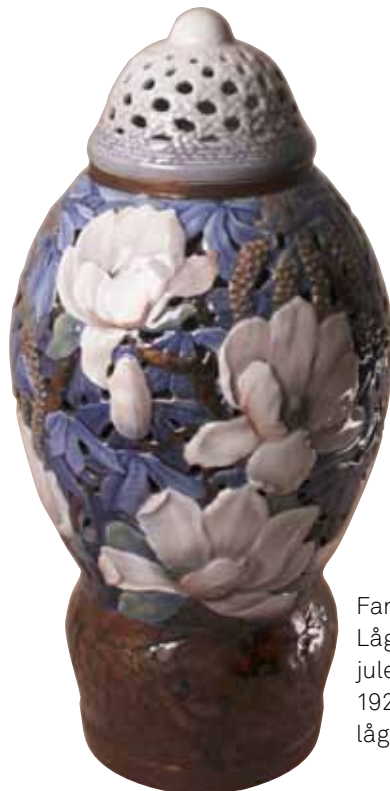
Fanny Garde: Lågvasen med juleroser. 1924, h. med låg 52 cm