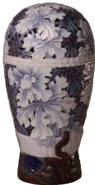
Effie Hegermann-Lindencrone: Lågvasen med egeløv og rønnebær. 1920, h. 30 cm